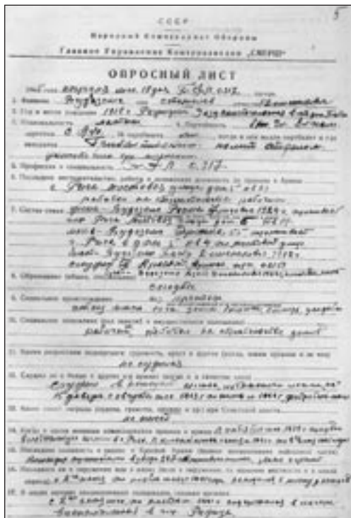
Küsitlusleht. LVA, f. 1821, s. 60570, l. 5p

masinkirjas ülekuulamise protokoll ( protokol doprosa ). Kokkuvõttes vastab see üldkehtivale riikliku julgeoleku organite ülekuulamisprotokolli vormile, ainult selle erinevusega, et käsikirjalises variandis ei ole fikseeritud aeg, millal ülekuulamine on alanud ja millal lõppenud. 48 Protokollis on kajastatud filtreeritava isiku andmed – perekonnanimi, nimi, isanimi, sünniaasta, elukoht: maakond, vald, talu nimetus, ka sotsiaalne päritolu, perekonnaseis, karistus (isiku suuliste ütluste põhjal). Peale selle on niisuguses protokollis näidatud isiku tegevus Saksa okupatsiooni ajal ja enne seda; alalisest elukohast väljasõitmise asjaolud; sõjaväelastel – mis asjaoludel sattus sõjavangi, piiramisse, Saksa sõjaväkke, 49 ning ka see, millega isik välismaal tegeles.