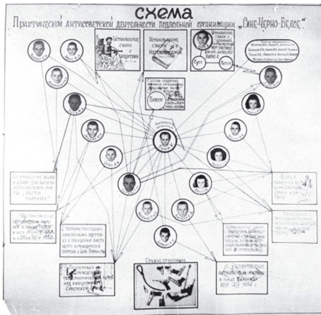
Julgeoleku poolt 1950. a. koostatud skeem organisatsioonist "Sini-Must-Valge". (ERAF, f. 129, s. 23635, k. 5)

samuti tõsiasi, et koolis tegutseb põrandalune õpilasorganisatsioon “Vaba Eesti” 10 . Uurimise jätkudes ja uute andmete kogunedes sai teatavaks ka mitmete Tartu 6. Keskkooli õpilaste “kodanlik-natsionalistlik” meelestatus. 1. kuni 16. novembrini 1950. a. areteeriti 35 organisatsiooni kuulumises kahtlustatavat. 11 Läbiotsimiste tulemusel sattusid julgeoleku kätte organisatsiooni põhikiri, tegevuskava, pitsat, vande-tekstid ja märgid – kõik need kuulusid aga Sini-Must-Valge (SMV) nime kandvale organisatsioonile. Pärast lühiajalist segadust jõudis julgeolek arusaamisele, et üheaegselt on jälile saadud kahele täiesti eraldi seisvale