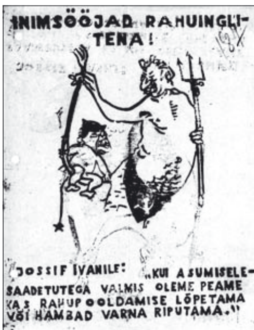
SMV poolt 1950. a. Tartus ja Viljandis levitatud lendleht. (ERAF, f.129, s. 23635, k.5)

Seega võisid julgeolekutöötajad 1950. a. maipühade järel olla üsna kindlad, et nende poolt eelmise aasta lõpus likvideeritud SKO polnud ainus Tartus aktiivselt tegutsenud vastupanuorganisatsioon. Koolides tehti jälle käekirjaproove, kuid tulemuseta. 13. septembril 1950 langetas Moskva erinõupidamine SKO asjas esimese otsuse, mille tulemusena organisatsiooni juhid mõisteti 25-ks, teised liikmed 10 aastaks erinevatesse Siberi vangilaagritesse. 1949. a. novembris Tartust Raadi pargist leitud süütenöörijuhid, suitsuotsad, sündmuskoha skeem ning