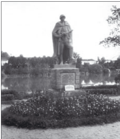
Tartu Raadi pargi monument Suures Isamaasõjas langenud punaarmeelelastele.

■ 6. novembril 1949 kell 4.00 helistas Tartu “Raadi” õppemajandi partorg Sivenkov miilitsasse ja teatas, et Raadi pargi vennas-haual asunud monument Suures Isamaasõjas langenud Nõukogude sõduritele on õhku lastud. Esimestena olid juhtunud märganud varahommikul majandisse tööle tulnud lüpsjad.