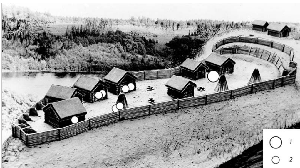
Joonis 3. Araabia müntide leiukohad Rõuge linnamäel. 1 – aare, 2 – üksikmünt. Joonis: J. Ratas

mullaga täidetud lohk avastati ka Rõuge asulas. 29 Arvatavasti kuulus linnusest avastatud leease mingi hoone juurde, mida arheoloogilistel kaevamistel fikseerida ei õnnestunud. Rekonstruktsioonil kujutatud kõrvalasuv hoone on sellest leesemest igatahes hilisem. Mingi rajatis seisis tõenäoliselt ka ühe linnuse lääneosas asunud püstkoja asemel. Sellele viitavad sealse leeseme juurest avastatud kaks kuufa münti. 30 Ka kõik ülejäänud linnuselt päevavalgele tulnud 8. sajandi lõpu – 9. sajandi alguse araabia hõberahad paiknesid rekonstruktsioonil näidatud hoonepõhjadel (joon. 3). 31