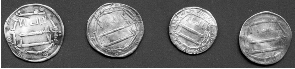
Joonis 1. Neli Rõugest leitud münti.

aare (tpq 837/838). 10 Seetõttu võib Rõuge leidu klassifitseerida koguni Eesti kõige varasema mündiaardena.