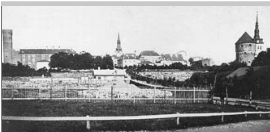
Vaade Toompeale Tõnismäelt 1862. a. Foto: C. Borchardt. EFA 0-47171

Igale Tallinna külastajale paistab silma Toompeal kõrguv sibulkuplitega hoone. Enamikule välituristidest jääbki just see kirik kõige silmapaistvamaks mälestuseks Tallinnast. Eestlaste jaoks on sel hoonel aga teine tähendus. Kuna Aleksander Nevski katedraal on läbi aegade riivanud paljude eestlaste tundeid, on päris mitmel korral tehtud juttu selle lammutamisest. Alljärgnev ongi väike ülevaade katedraali ähvardanud ohtude ajaloost.