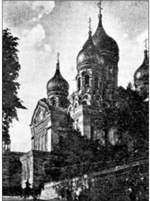
Aleksander Nevski katedraal Tallinnas 1924. a., Agu 1924, nr. 1, lk. 688

hendatud õigeusu kirik. 4 Uudise autor J. K. tuletab meelde, „et ka meil mitmed veneaegsed palveonnid Tallinnas avalikke platse rikuivad ja alles ikka ärakoristamata on. Ka peaks tõsiselt küsimus üles võetama Toompea Vene kiriku teise paika toimetamise kohta”. Seegikord jäi see vaid üleskutseks.