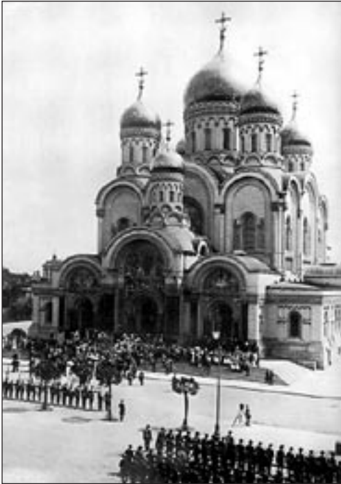
Aleksander Nevski katedraal Varssavis, u. 1912. a. Repro