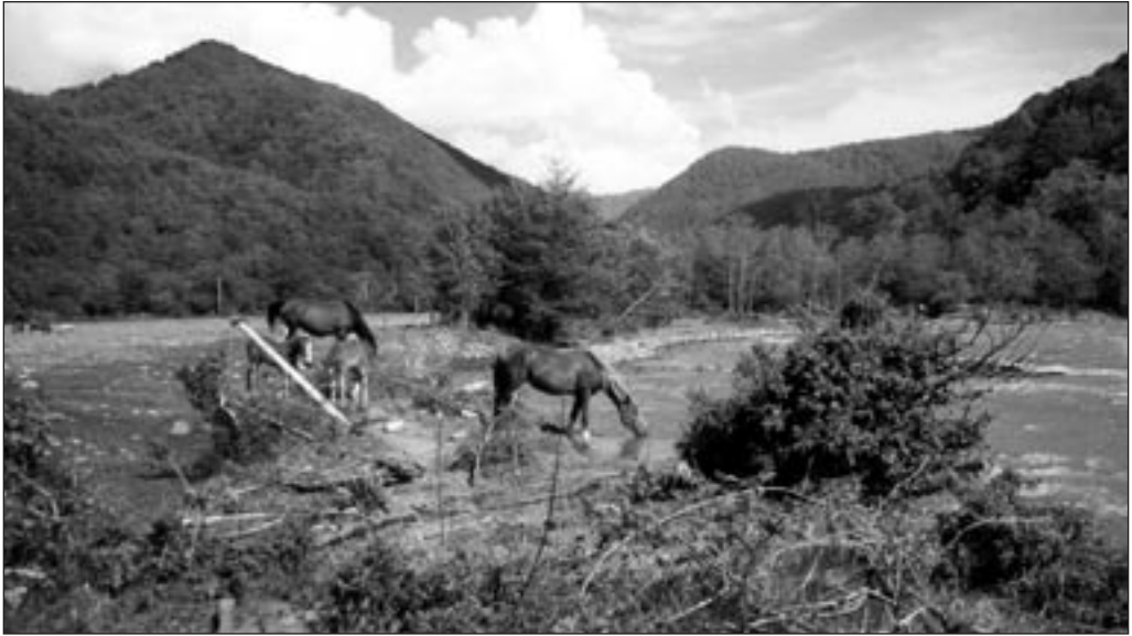
Hobused Eesti-Rohuaia külatänaval. 2000.

olnud keskmine, paergu on lund pool arssinat maas ja sajab. Nii kõik see elu läheb.