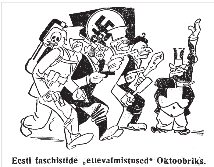
Karikatuur 1933. a. 6. novembri Edasist.

poole suur sara, ja hobuste tall tehti ka uuesti ringi poole suuremaks.