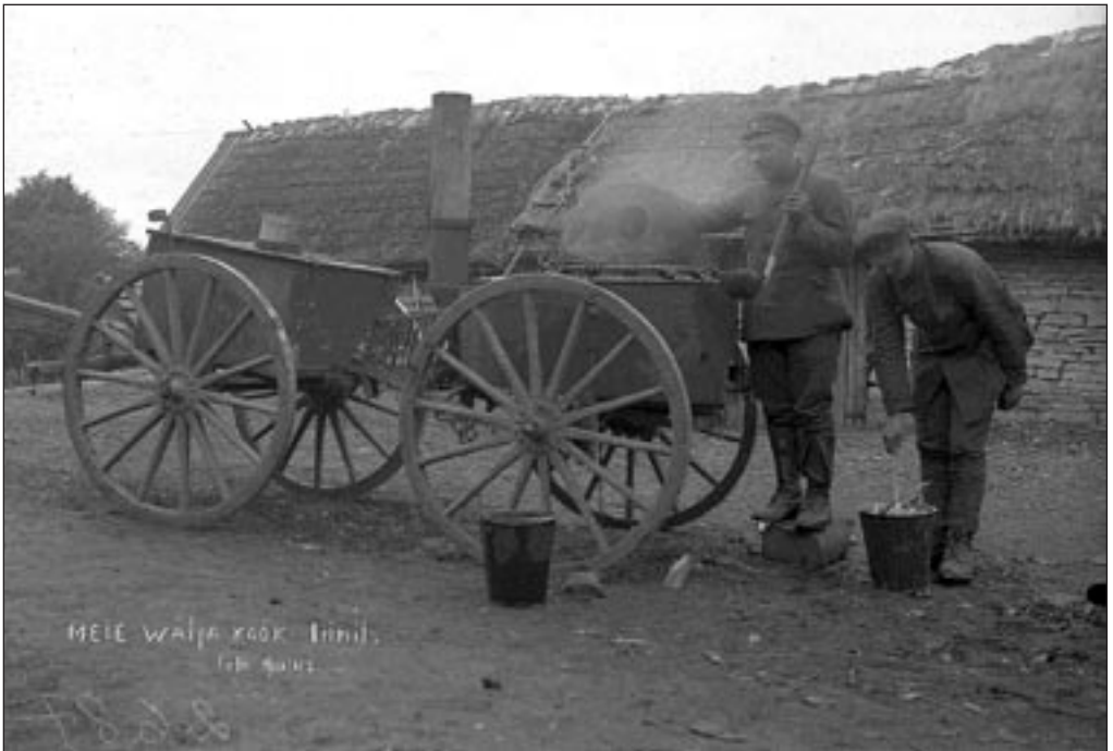
Välüköök rindel 1919. aastal. EFA 4-2687