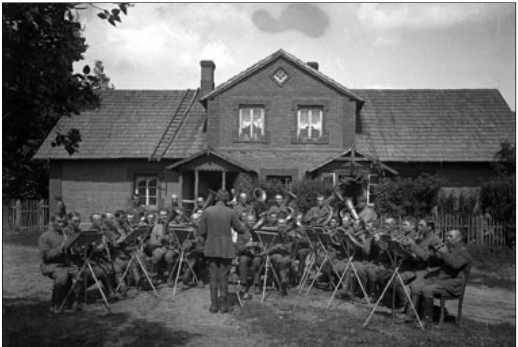
1. polgu orkester mängib Riia rindel 1919. aasta suvel. EFA 4-2668