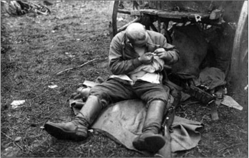
Sõdur rindel võitluses „sisemise vaenlasega” 1919. aastal. EFA A-287-161