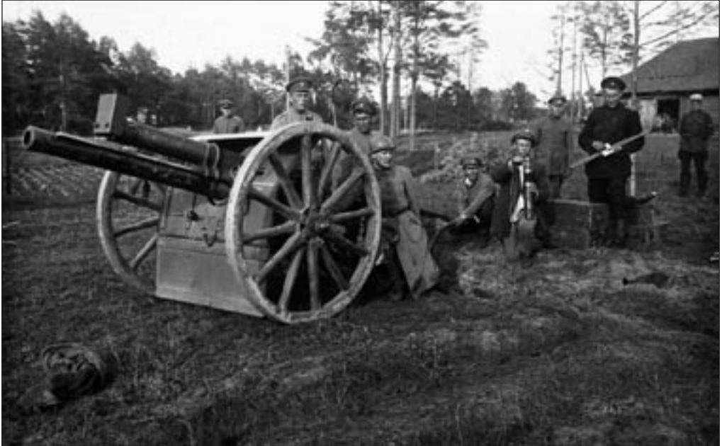
Meeskond tegevuses 84mm Inglise välikahuri juures Landesveeri sõja ajal 1919. a. juunis. EFA A-287-246