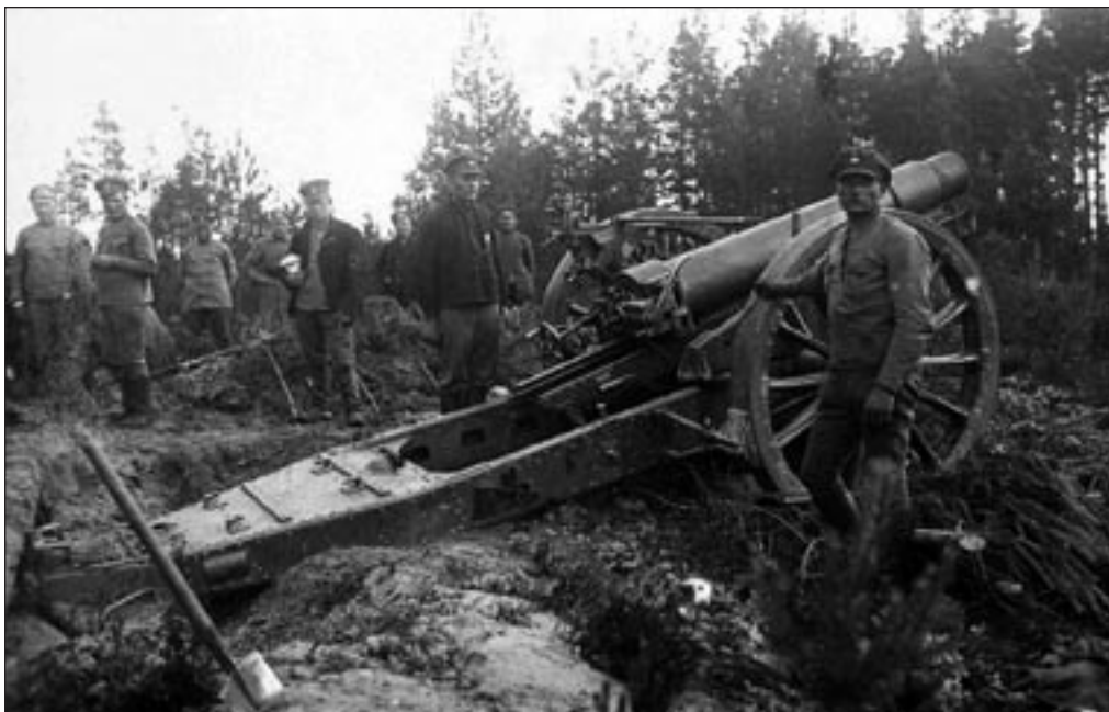
Kuperjanovi partisanide patarei 152mm Vickersi haubits Landesveeri positsioone tulistamas 1919. a. juulis.