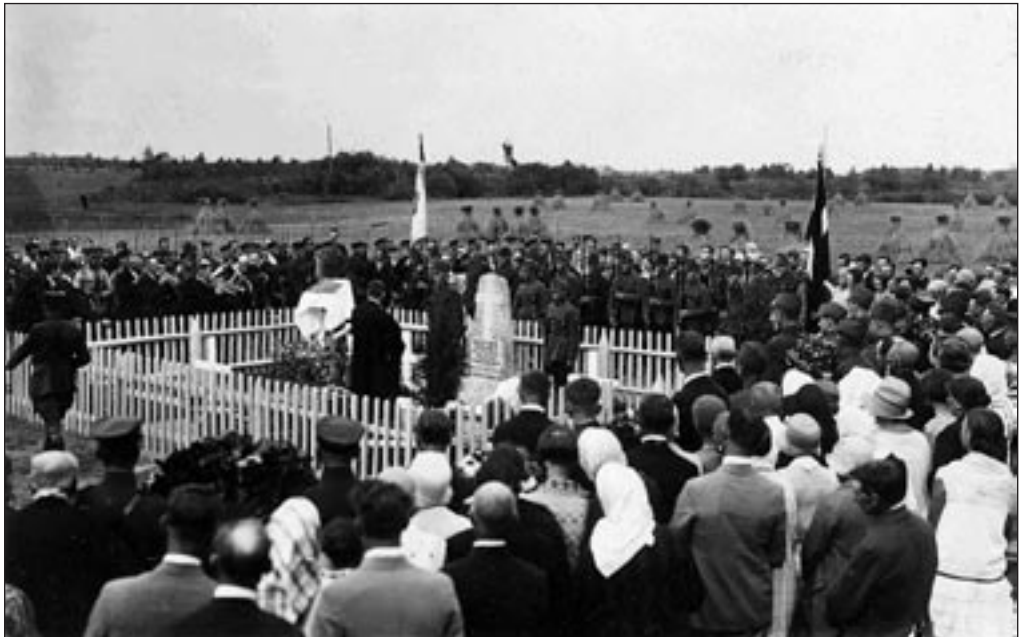
„Puhake rahus võeras mullas!” Landesveeri sõjas langenud ja Salaspilsi surnuaeda maetud Eesti sõduritele Läti kaitseväelaste poolt püstitatud mälestusmärgi avamine 19. augustil 1929. a. Mälestusmärk taastati 1990. aastal. EFA 0-53621