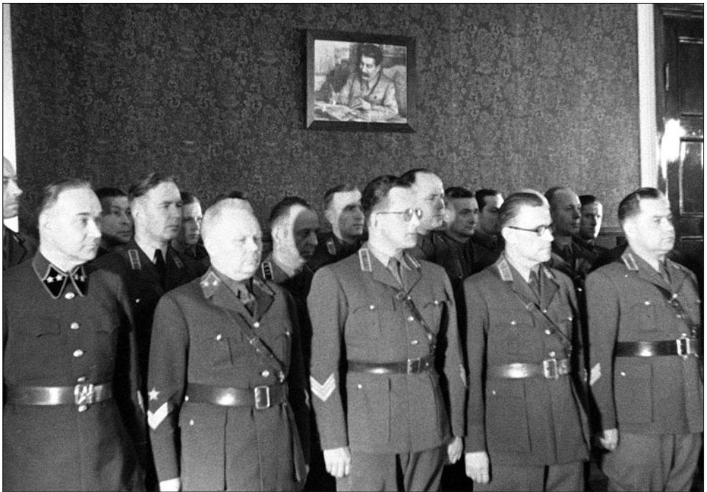
Eesti NSV Territoriaalkorpuse ohvitserid annavad Punaarmeele vandetöötuse 23. veebruaril 1941. Kaader ringvaatepalast, arhivaal 445. EFA 0-135054