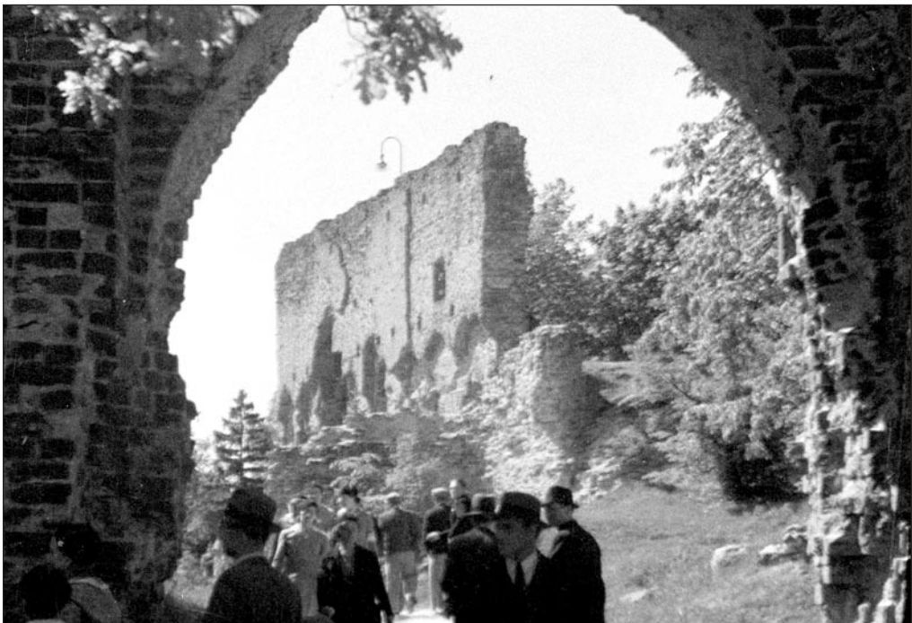
Kaader filmist „Viljandi“, aastast 1940, arhivaal 296. EFA 0-133831