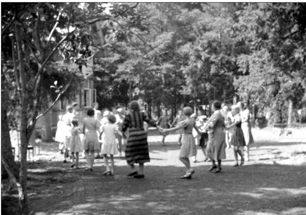
Kodutütred Rannamõisa suvekodus 1939. a. Kaader ringvaatest, arhivaal 279. EFA 0-130460