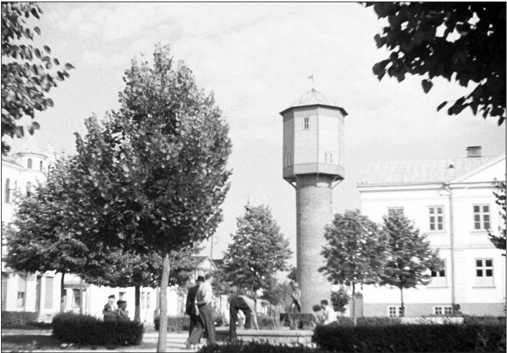
Kaader filmist „Viljandi“, aastast 1940, arhivaal 296. EFA 0-133834