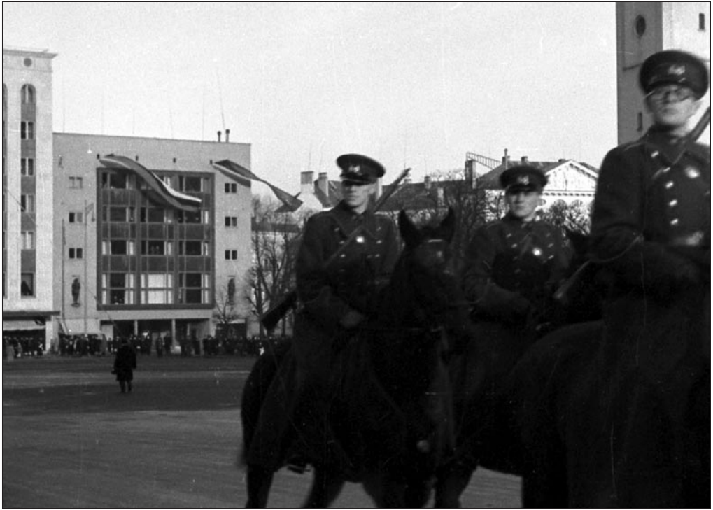
Tallinna-Harju politsei 20. aastapäeva paraad Vabaduse väljakul aastal 1938. Kaader ringvaatest, arhivaal 232. EFA 0-130674