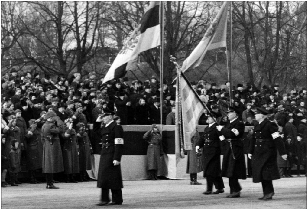
Eesti Vabariigi 21. aastapäevale pühendatud sõjaväeparaad Vabaduse väljakul 1939. a. Kaader ringvaatest, arhivaal 262. EFA 0-130442