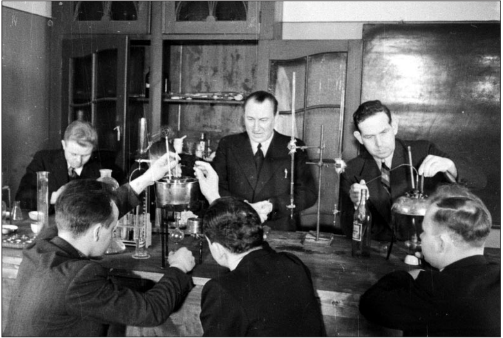
Tallinna Merekooli kursandid laboratooriumis määre- ja kütteaineid analüüsimas. Kaader ringvaatest, arhivaal 267. EFA 0-130675