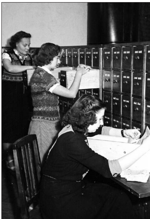
ENSV Miilitsavalitsuse Aadressbüroo töötajad kartoteegi juures. 1956.

1954 seoses piirangute mahavõtmisega kokku 2921 passi. 62