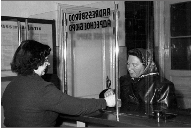
ENSV Miilitsavalitsuse Adressbüroo töötaja ulatamas aadressiteatist kodanikule. 1956.

andmeid võib pidada usaldusväärseks, sest neid kasutati operatiivtöös ning kuivõrd institutsioon teadis, et need andmed jäävad ametkondlikuks kasutamiseks kitsale ringile, siis polnud nähtavat motiivi nende moonutamiseks. 5 Sellega üldiselt nõustudes tuleb samas mõnda, et kogu passistatistika ei pruukinud olla kasutatav operatiivtöös ning usaldusväärse hindamisel tuleb lähtuda iga andmeliigi iseloomust. Elanikkonna dokumenteerimise ja eriti dokumendiplankide liikumise üle peeti väga ranget arvestust ning väljastatud passide statistikat julgen pidada õigeks, ehkki teatav veavõimalus on olemas – näiteks võisid kohalikud passilauad püüda varjata passiplankide kaotsiminekut.