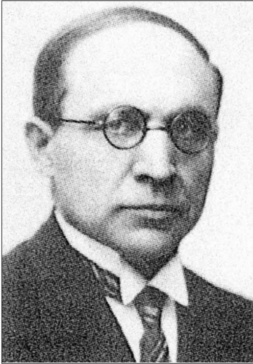
Jüri Uluots (1890–1945).

üldõpetus”, 1923; “Eestimaa õiguse ajalugu”, 1930; “Eesti Vabariigi konstitutsioonilised aktid”, 1937; “Riigipea instituudi kujunemine Eestis ja 1937. a. Põhiseadus”, 1937). 46