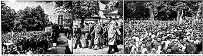
Tööliste esitlised meeleavaldusel.

Tööliste esitlised oma nõudmisel vahariigi presidendide. - Pika Hermann tori heitsi punane lipp