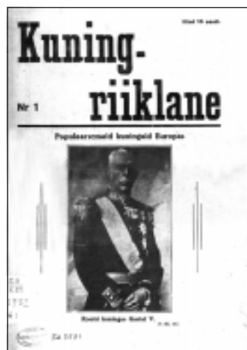
Ajakirja Kuningriiklane ainsa numbriga. 1932