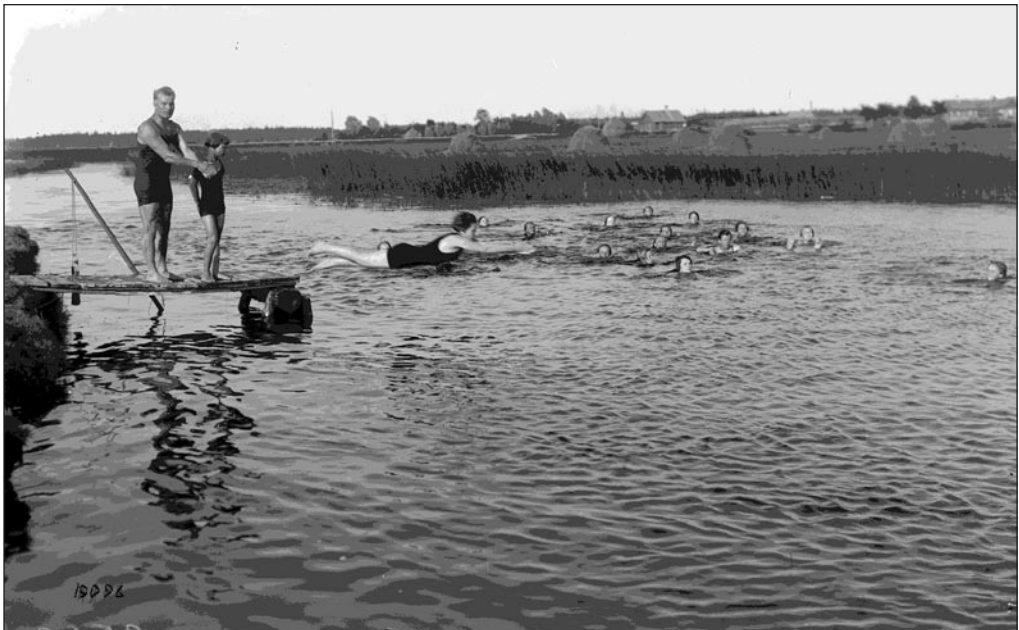
Ujumiskursused Paides 1927. aastal. EFA 3-9569