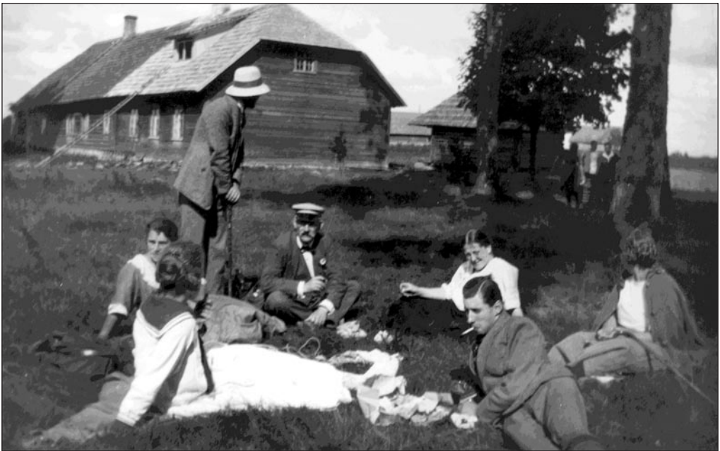
Grupp Viljandi saksa kooli õpetajaid suvisel väljasõidul 1930. aastatel. EFA 0-64568