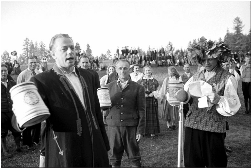
Jaaniõhtu Nelijärvel 1956. aastal. Esinevad isetegevuslased. EFA 0-10013