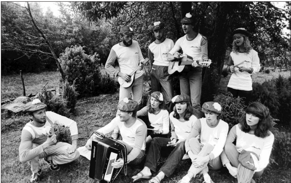
Eesti Üliõpilaste Ehitusmaleva Uuemõisa rühma liikmed valmistuvad taidlusülevaatuseks juulis 1984.