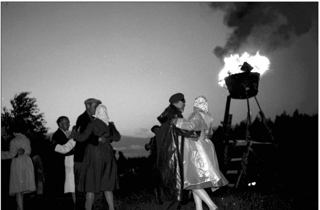
Jaaniõhtu Võrtsjärve kolhoosis 1962. aastal.