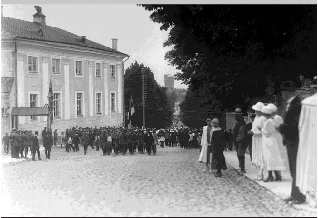
Õpilaste rongkäik Asutava Kogu ette 1919. aasta jaanipäeval. Tõenäoliselt on see rongkäik ajendatud eelmisel päeval toimunud Võnnu lahingu võidu teatest.

Lühikese Eesti suve üks tähtsamaid üritusi on jaanipäev, õigemini jaanilaupäev. Päris palju fotosid oli leida Nõukogude ajast, mil pidu võis pidada deviisi all „vormilt rahvuslik, sisult sotsialistlik”. Rahvariideid ja vanu kombeid (kõievedu) võis maal kolhoosipidudel tihti näha. Ja eks enamik inimesi püüdis ikka selleks ajaks kuhugi maale, näiteks saartele minna. Praamijärjekorrad olid pikad, nagu nüüdsel ajalgi. Et jaanilaupäevad kipuvad ikka vihmased olema, seda on näha ka fotolt, kus vihmakeepides paar tantsu keerutab. Aga ei ole halba ilma, on vaid vale riietus!