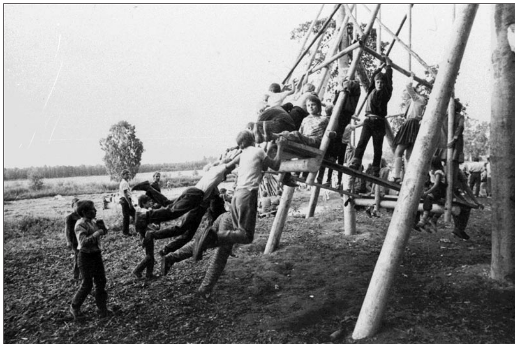
Jaanituli Härglas Raplamaal 1988. aastal. EFA 0-144809