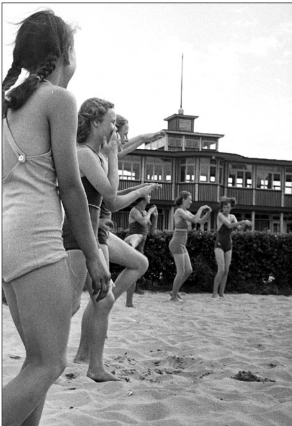
Ujumiskursustest osavõtjad teevad esialgu harjutusi Mustamäe basseini veerel Nõmmel 1939. aastal.