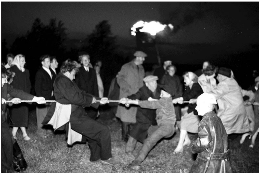
Kõievedu oli üks traditsioonilisi spordialasid rahvapidudel. Võrtsjärve kolhoosi jaanipeol 1962. aastal. E. Veliste. EFA 0-131924