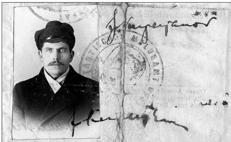
J. Kuperjanovi foto isikutunnistusest 1918. a.