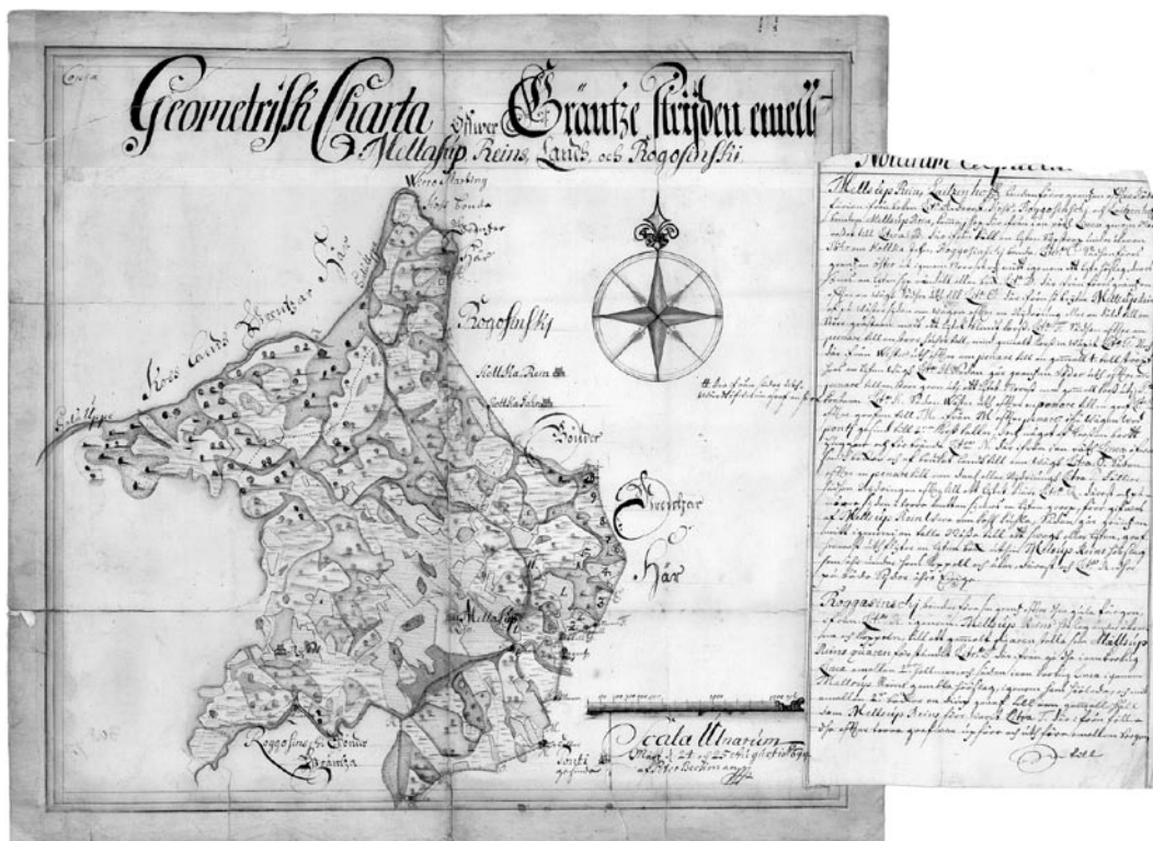
Võrumaa Ruusmäe ja Viitina piirikaart 1694. EAA, f. 308, n. 2, s. 179